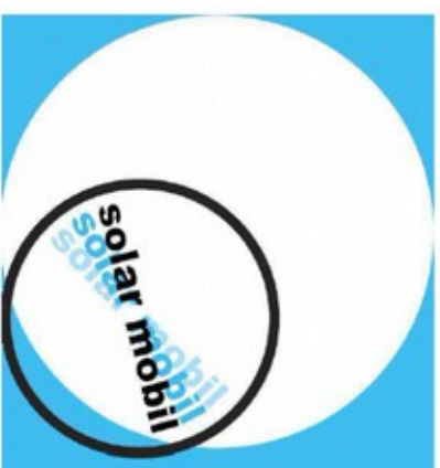
Solar mobil Heidenheim e. V.

Hiermit berechtige ich widerruflich Solar mobil Heidenheim e. V. zur Lastschrift